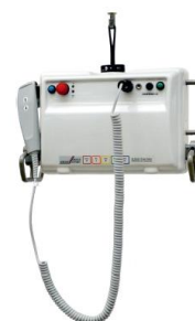
Portabler Deckenlifter UPL