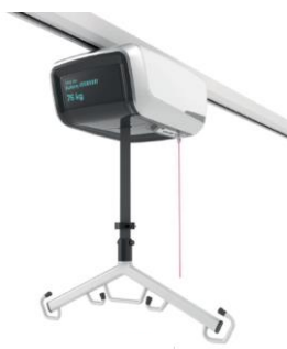
Deckenlifter UNILIFT Pro